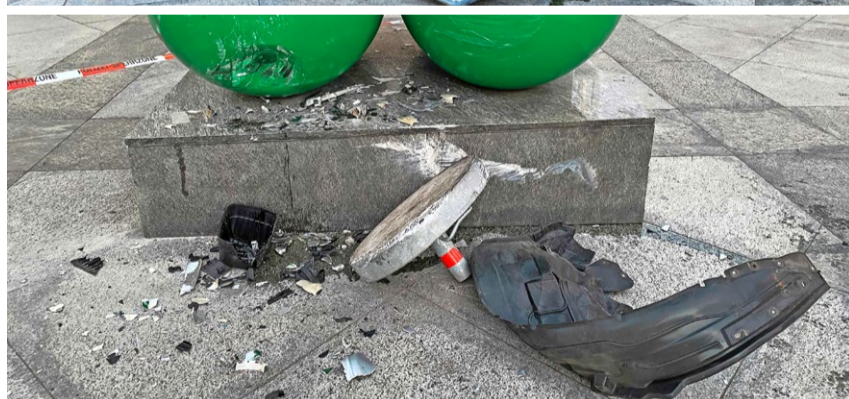
Erst das Kunstwerk brachte das Auto zum Stillstand. Der Sachschaden lässt sich noch nicht beziffern.