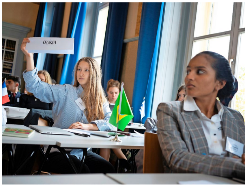
Wie vertrete ich mein Land? Schülerinnen proben den UNO-Auftritt.

Neben dem Institut Montana sind sieben weitere Schulen aus der Schweiz, Deutschland und Holland Teil der Konferenz und über 20 verschiedene Nationalitäten vertreten. Die Teilnehmer befassen sich mit einem umstrittenen Aspekt des technologischen Fortschritts: der Genforschung. Konkret wird über die Weiterentwicklung von genetisch