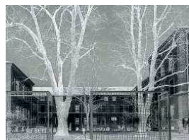
Weiss wird zu Schwarz, Schwarz zu Weiss. Mit dieser Umkehrung – im Bild die Klinik Burghölzli – verwirrt der Fotograf seine Betrachter.

sehr wenig», sagt Jokeit, während wir durch den Park der Klinik Lengg über dem Zürichsee schlendern. Noch immer sei es nicht möglich, mit einem Blick in das Hirn schwere psychische Erkrankungen wie Depressionen oder Schizophrenie zu erkennen. Ganz anders als bei einem Bruch: wo selbst ein Laie mit einem Blick auf ein Röntgenbild erkennen kann, ob ein Knochen in zwei Hälften getrennt ist oder nicht.